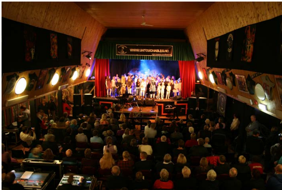
Fullt hus - Jevnaker kulturskole på Glassheim 2009

Jevnaker har to kirkebygg av relativt god kvalitet. En nedsatt komité utreder tilrettelagte endringer for flerbruk av Randsfjord kirke, med tanke på å kunne bruke kirkerommet til langt flere og mer mangfoldige aktiviteter. Dette er spennende planer som også for kulturlivet kan åpne for nye muligheter for aktivitet og formidling. Det vises for øvrig til Kirkeplan for Jevnaker minighet 2009-2013.