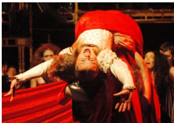
Fra Wich Witch – Jevnaker korforening og Hadeland Janitsjar 2008

Den frivillige sektoren er en helt sentral del av Jevnakers kulturliv. Lag og foreninger som rapporterer til Jevnaker kommune sysselsetter vel 3500 mennesker, over halve kommunens befolkning. Av dette er 1200 barn og unge (Tall for 2008). Et utviklingstrekk i tiden som man også ser på Jevnaker er en forskyving fra organiserte aktiviteter i lag og foreninger over til mindre grupperinger med større eller mindre grad av formalisering. Stadig mer frivillig arbeid gjøres utenfor lag og organisasjoner.